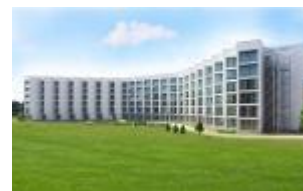
Costo per 1 – Piacere per 2 nell' rinnovato albergo Terme