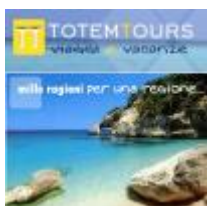
Confidenziale per gruppi