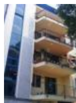
2 locali vendita Milano Rif. V000248