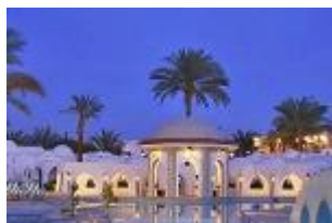
Ponti di novembre a Sharm El Sheik!