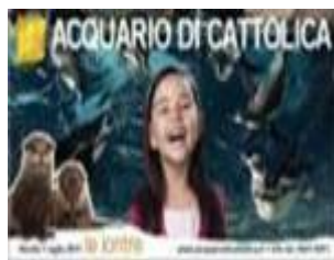
Acquario di Cattolica: Apertura serale 2011