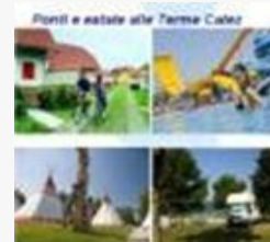
Ponti e estate alle Terme Catez